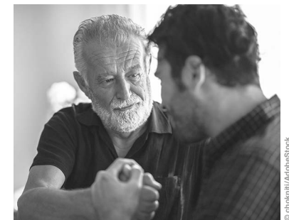
Unterstützend S. 36-37