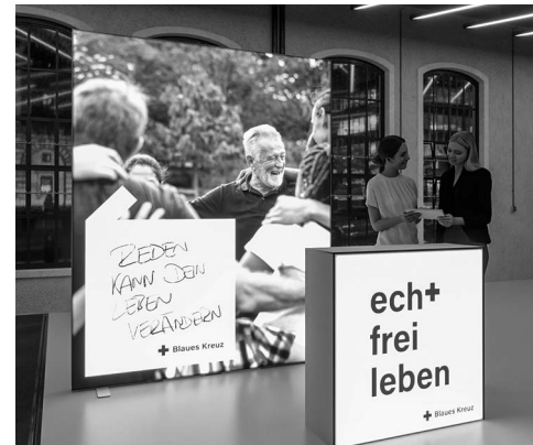
Öffentlich S. 34-35