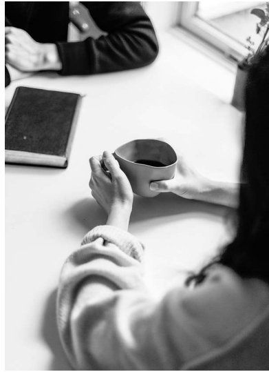
Betreuend S. 12-15