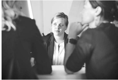
Beratend S. 8-11