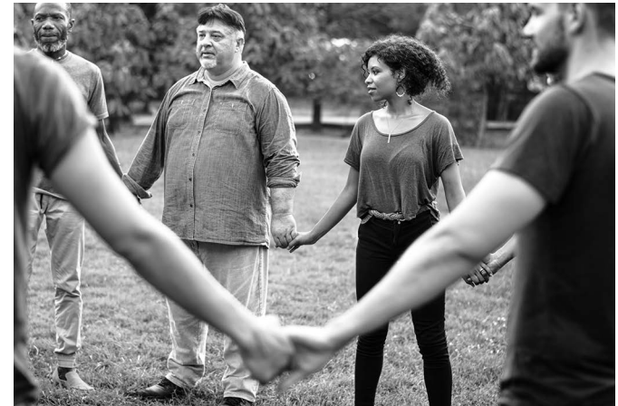
Gemeinschaftlich S. 24-33