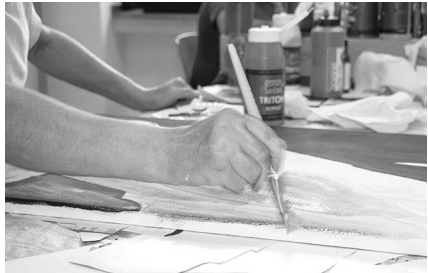
Rehabilitativ S. 16-17