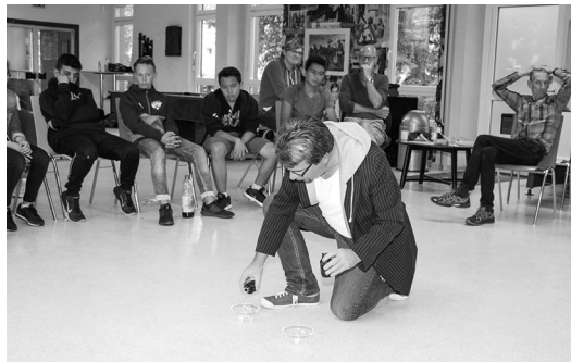
Präventiv S. 18-23